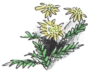
イラスト 亀田 眞理子

「言葉は心をつなぐ大切な道具だ」 「言葉はコミュニケーションの道具として」 「相手に意図を伝えないで済むこと」 「その言葉が誰よりも先に」 「自分の鼓膜を震かせ」 「潜在意識に影響するものだ」