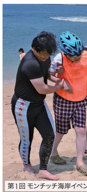
第1回 モンチッチ海岸イベント

6年間、NONちゃん倶楽部に関わる中で、障がいのある方への考え方や接し方が大きく変わりました。私が関わるのはイベントの間だけですが、普段の生活の中でご本人やご家族が抱える苦勞は計り知れません。それでも、悲観するのではなく前向きに人生を楽しむ姿に、たくさん学ぶことができました。NONちゃん倶楽部は、障がいのある方が新しい一歩を踏み出す場であり、それをサポートする一員となれたこと、本当に嬉しく思います。実際に、できなかったことが出来るようになる瞬間に立ち会えたことは、私にとってかけがえのない経験でした。